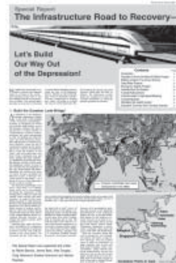
Il CEC infrastruttura programma nazionale.