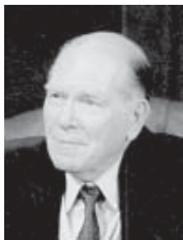
L'economista americano e candidato presidenziale per il 2004, Lyndon H. LaRouche, Jr.

Tale collasso finanziario scuoterà l'oligarchia finanziaria mondiale fino alle radici. Tuttavia loro intendono mantenere il controllo come lo fecero nel 1930, promuovendo guerre e dittature fasciste. In quei tempi l'élite australiana creò gruppi fascisti, come la Nuova Guardia, la Vecchia Guardia e la Lega di Sicurezza Nazionale – 100.000 uomini in tutto – che avevano in programma di effettuare un colpo di stato piuttosto che permettere al Partito Laburista di Frank Anstey. Jack Lang, Ted Theodore e John Curtin di controllare il Credito Bancario per il Benessere Comune. Proprio le