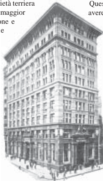
Il primo quartier generale della Commonwealth Bank di King O'Malley, Martin Place, Sydney.

Costruiamo un futuro per tutti gli Australiani, ora, e per le generazioni future. Votando e collaborando con il CEC in queste elezioni, potrete mettere questi programmi in luce, sia in questo Stato, sia in tutta la nazione. Ricordate che se votate per qualcun altro, che i mezzi di comunicazione reputano "più credibile" o "più eleggibile", e ottenete un certo disastro, avrete da biasimare voi stessi. Votate invece per un deputato di un partito in veloce aumento, il CEC, e incuterete un terrore nelle istituzioni governative come non lo hanno mai conosciuto prima. Voi cittadini avete una scelta — se la userete saggiamente — di istituire il CEC e i suoi programmi per una istituzione bancaria nazionale per un rinascimento nei settori finanziari e agricoli sulla strada per divenire il maggior potere politico in questa nazione.